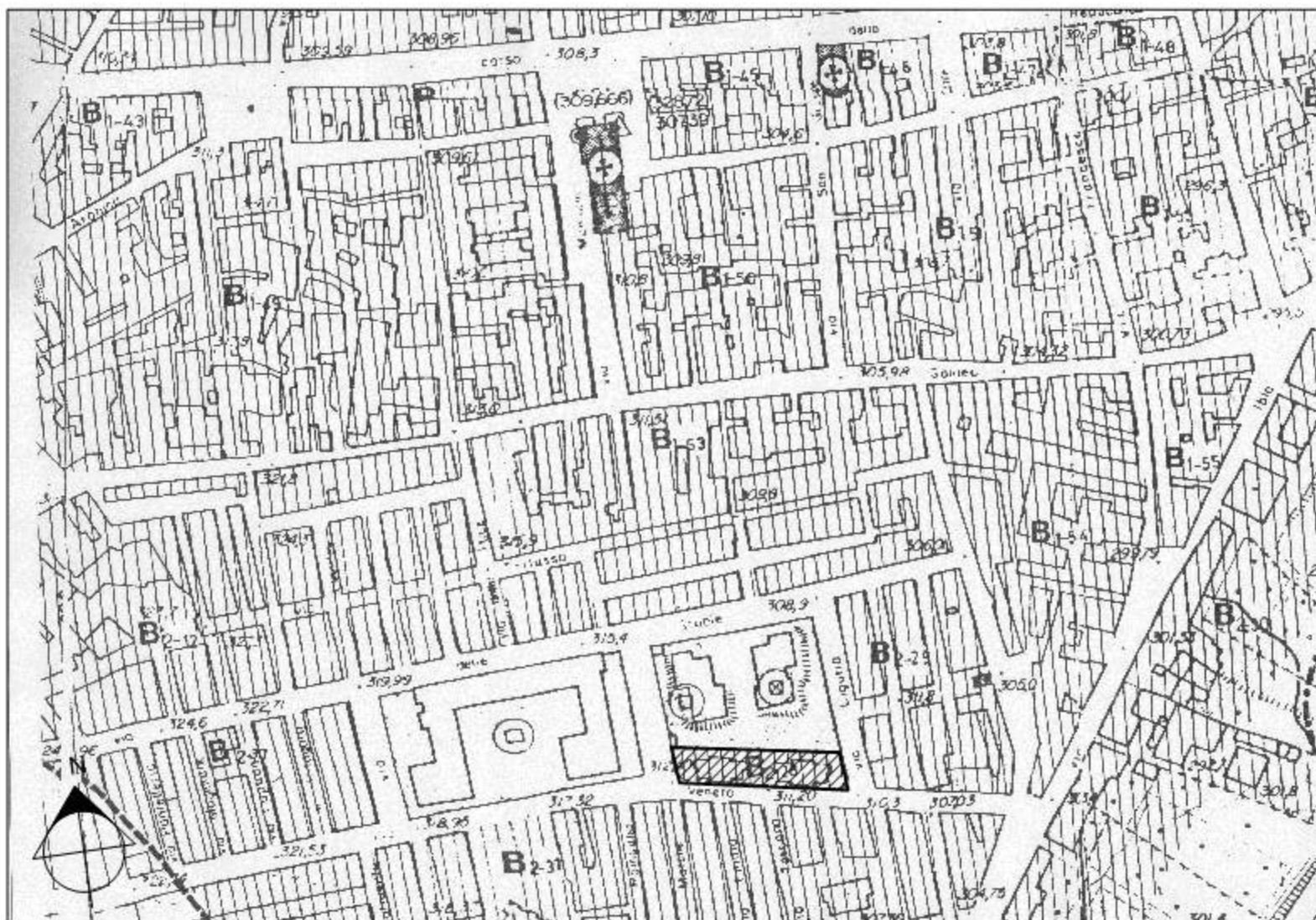
PLANIMETRIA P.R.G., STRALCIO - Scala R = 1:2.000